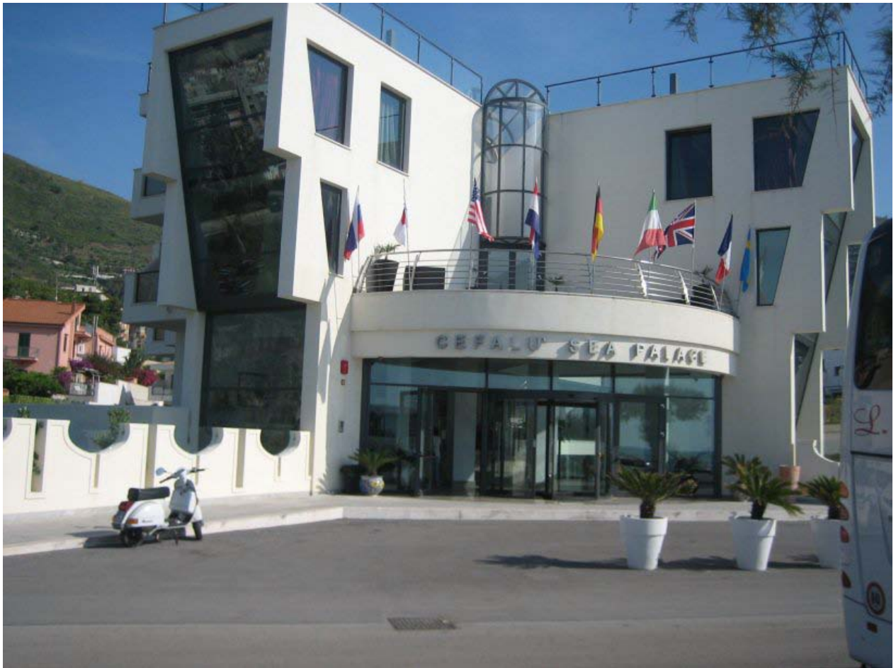
Mooie, moderne kamers. Type 21: superieure kamers met zeezicht en mooi uitzicht op Cefalù.